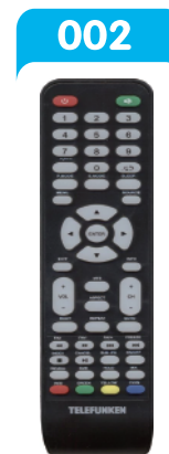
Telefunken CX-507 (11569)